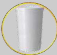
4. SELLADO DE FOILD