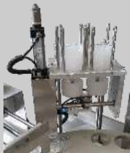
1. COLOCACIÓN DE ENVASES.